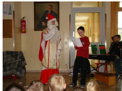
Interview mit dem Weihnachtsmann