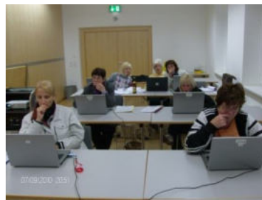
Konzentriertes Arbeiten und ...