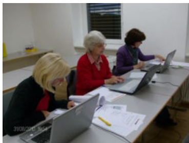
Drei Wochen Kurs für Einsteiger