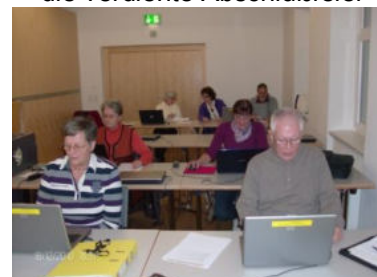
Workshop im Dezember 2010