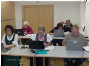
Kurs IV - PowerPoint & Co