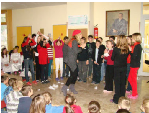
Nikolo und Krampus Rap