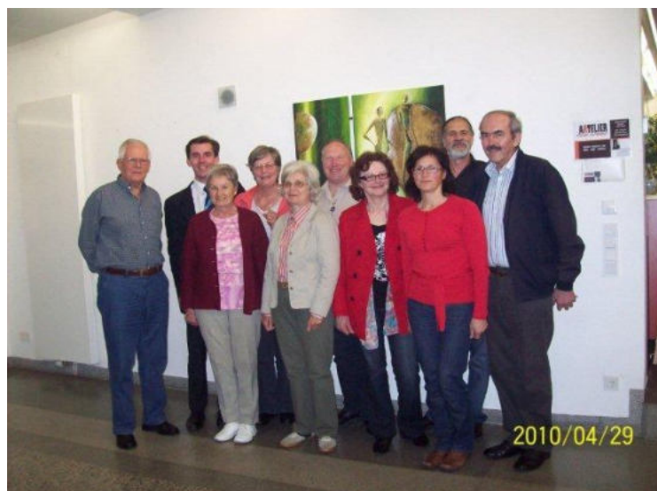
Abschluss Kurs III (Word, Excel, PowerPoint)