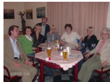
die verdiente Abschlußfeier