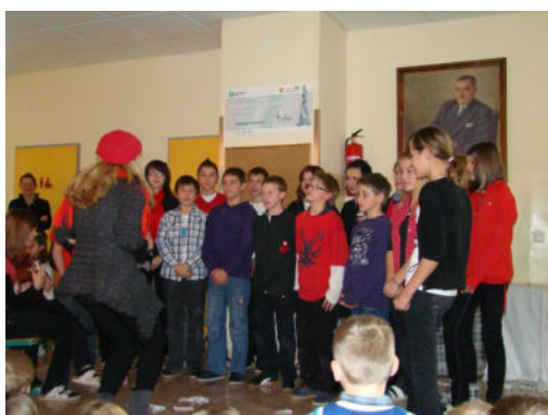
Happy X-mas (War is over)